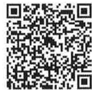
▲廃棄物処理の基礎 研修QRコード

●複数人申込の場合は合計金額でお振込みください。 ただし、申込は1名につき1申込み必要です。